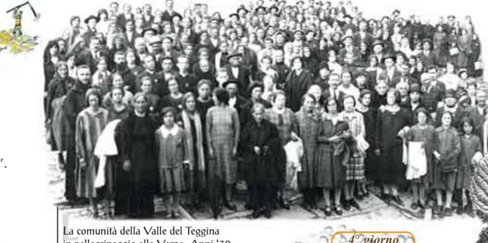
La comunità della Valle del Teggina in pellegrinaggio alla Verna. Anni '30