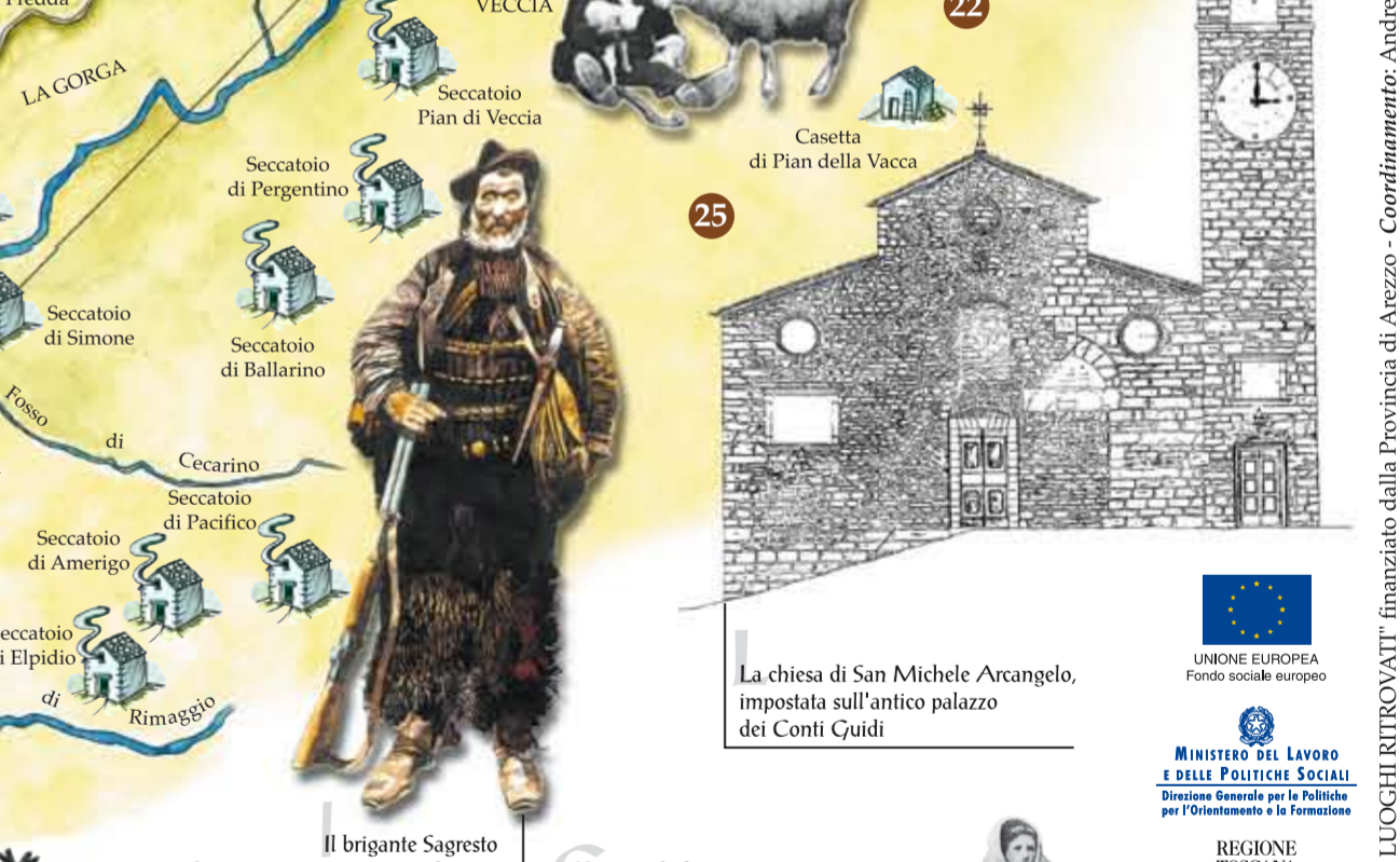
La chiesa di San Michele Arcangelo, impostata sull'antico palazzo dei Conti Guidi