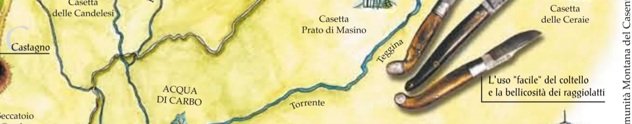
L'uso "facile" del coltello e la bellezza dei raggiolotti