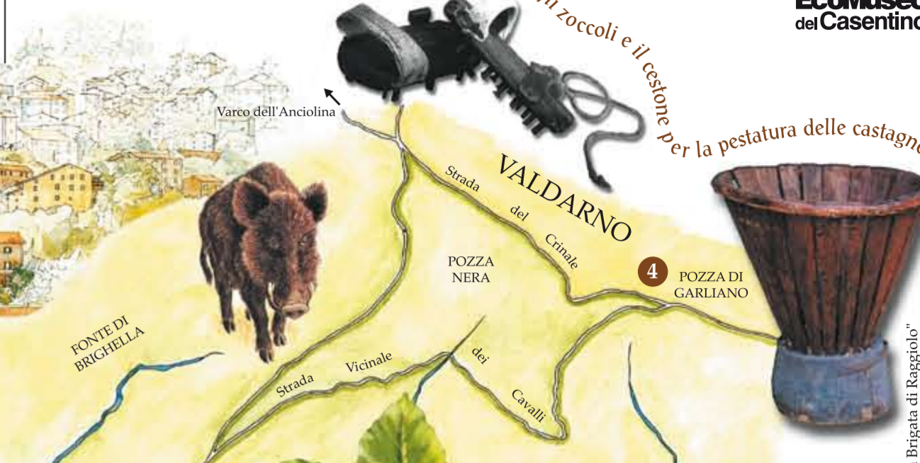
Gli zoccoli e il cestone per la pestatura delle castagne