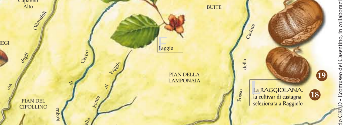
La RAGGIOLANA, la cultivar di castagna selezionata a Raggiolo