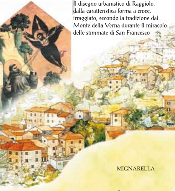
Il disegno urbanistico di Raggiolo, dalla caratteristica forma a croce, irraggiato, secondo la tradizione dal Monte della Verna durante il miracolo delle stimmate di San Francesco